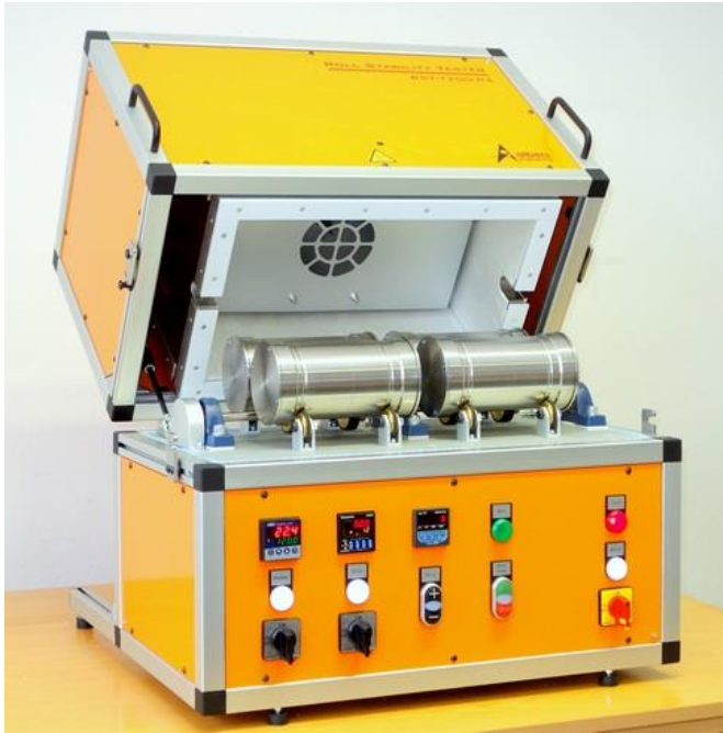
Roll Stability Tester RST-T200-P4