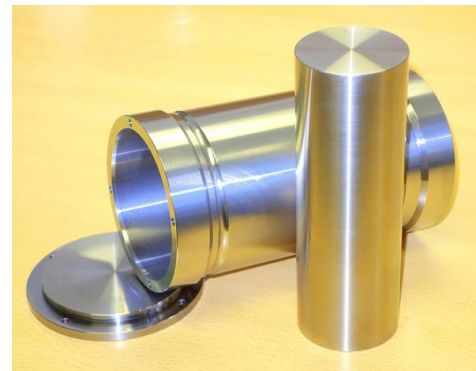
Prüfbehälter und Rollkörper