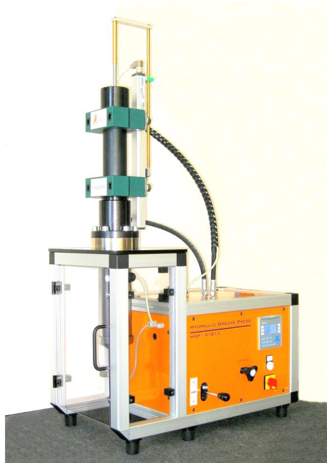
HGP PLUS - Technische Ausführung kann von der Abbildung abweichen!