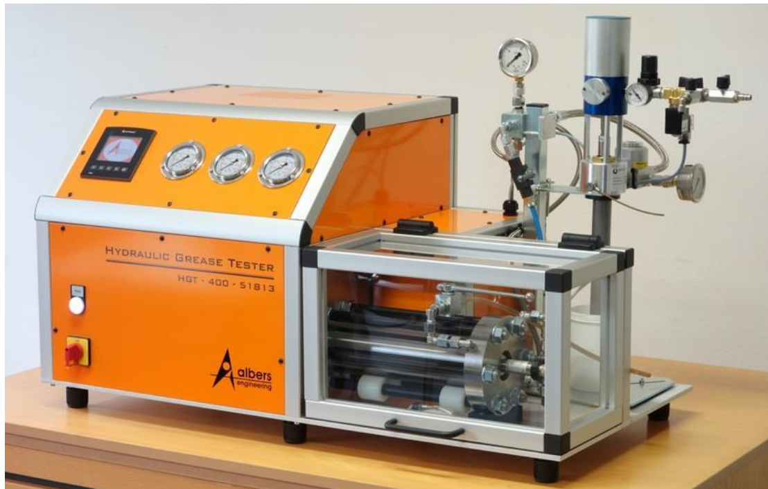
Hydraulic Grease Tester HGT-400-51813