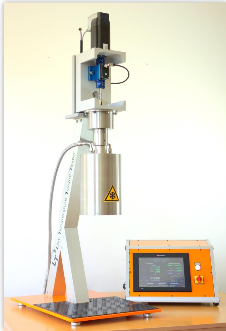
Low Temperature Torque Tester LT 3

(Die tatsächliche Ausführung kann von der Abbildung abweichen)